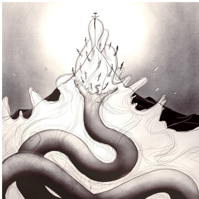
(obraz Kristem přemoženého Démona)

„Střeží-li silný muž v plné zbroji svůj palác, jeho majetek je v bezpečí. Napadne-li ho však někdo silnější a přemůže ho, vezme mu všechnu jeho zbroj, na kterou spolehal, a kořist rozdělí.“ (Lukáš 11,21-22)