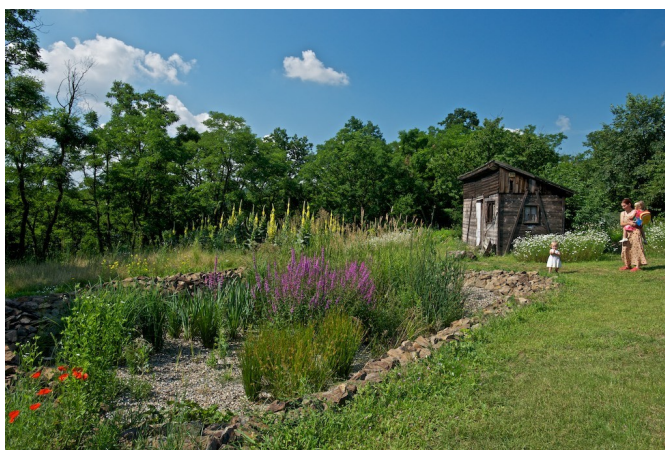
(takto vypadá kořenová čistička odpadních vod)

Od letošního ledna nabývá v platnost vyhláška nařizující majitelům nemovitostí a obcím kvalitně vyřešit čištění splaškové vody domácností. Vzhledem k tomu, že náš sbor vlastní rozsáhlý areál v Horní Krupé, v rámci kterého se nachází pět budov (počítáme-li přístavby ke škole zvláště), které mají všechny nějaké odpady, rádi bychom tuto záležitost vyřešili. Jednou z možností je vybudování tzv. kořenové čističky odpadních vod. V současné době je dokončen stavební projekt a rozpočet. Projektovou dokumentaci zpracovala firma Kořenovky.cz